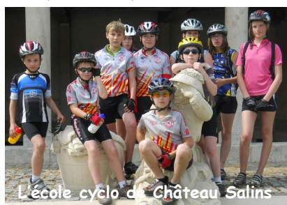
L'école cyclo de Château Salins