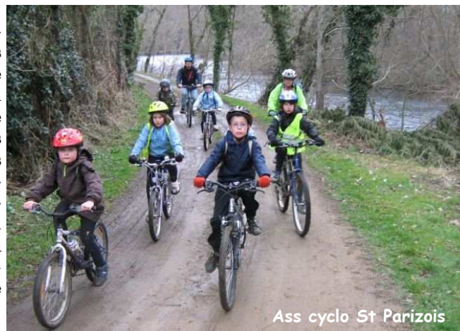
Ass cyclo St Parizois