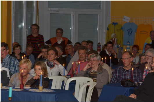
De la convivialité