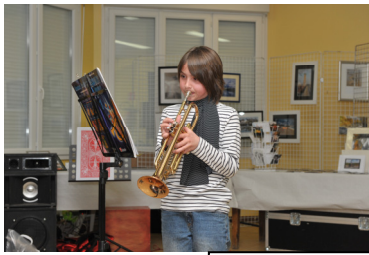
Des talents mais cyclos !