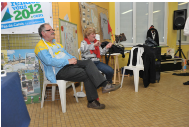
Un Président heureux tourné vers l'avenir