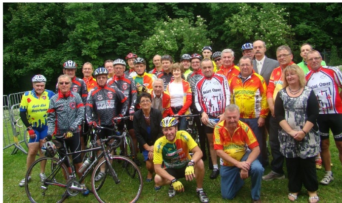
PHOTO SOUVENIR DE LA RANDONNEE DE L'ALL CYCLOTOURISME DU 10 JUIIN 2012 A LONGUENESSE