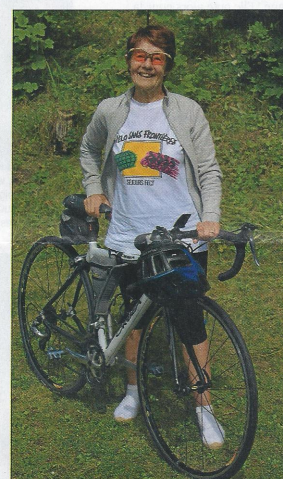
Jusqu'à 100 km de vélo par jour et le plaisir de découvrir des régions entre amis...

« Le plaisir d'être dehors, de voir de beaux paysages, de rencontrer des gens. Et c'est bon pour la santé. Je suis allée en Hollande et au Portugal. L'hiver, je vais rouler sur la Côte d'Azur. Nous découvrons aussi la Bretagne et rejoignons des amis en Angleterre chaque année, depuis dix-sept ans. Je peux faire jusqu'à 100 km par jour. Si je ne